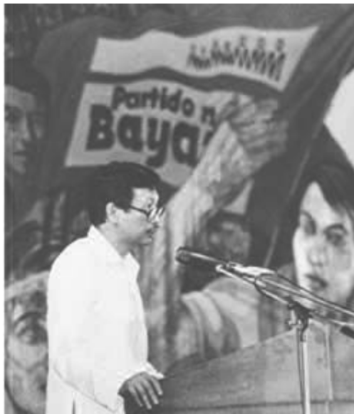
Ni Joema idi naibangon ti Partido ng Bayan, 1986