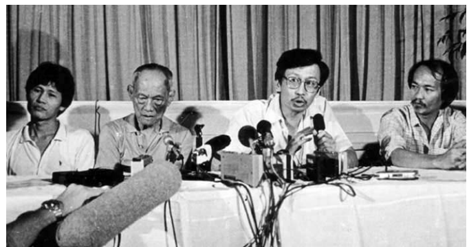
Da Joema, Dante Buscayno, Juan T. David iti maysa a press conference kalpasan a mawayawayaan da Joema ken Dante.

Idi Marso 5, 1986, kakuyog ti dadduma pay a politikal a balud, nawayawayaan ni Joema.